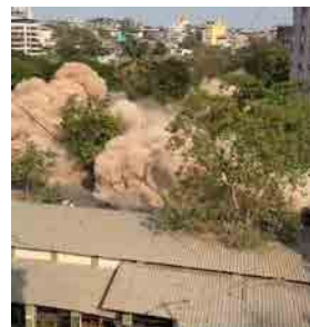
उल्हासनगर : धुळीचे लोट पसरले.